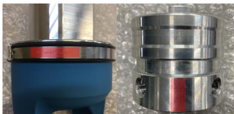
图 2. 序列号记载处