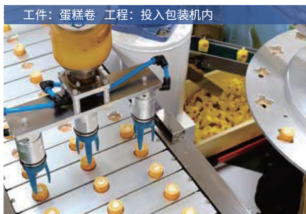
工件：蛋糕卷 工程：投入包装机内

抓取率：95%-97% → 100% 装置对应时间：最大 4 小时 / 日 → 0 小时 / 日 比人手更快、更准确、不知疲倦地进行拣选。一触式可拆卸，易于清洁，这一点也广受好评。