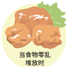
当食物零乱 堆放时